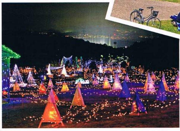
光のページェント TWINKLE JOYO 三角帽子