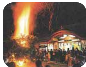
いごもり祭 (大松明)

木津川市 には、古来からの伝統行事がよく守り伝えられています。木津町の相楽神社では、1月15日に「御田」、2月1日に餅を花に見立てて奉納する「餅花」が行われます。2月の第3土日には山城町棚倉の涌出宮において南山城地方最古の奇祭といわれる「いごもり祭(居籠祭)」が行われます。「大松明」、「お田植」などの儀式は、室町時代中期の農耕儀礼の様子をよく伝えるものとして、国の重要無形民族文化財に指定されています。「蟹の恩返し」の縁起で有名な蟹満寺では、4月18日に縁起に因み、生命の尊さに感謝する蟹供養放生会が行われます。夏は、毎年、7月23日に泉橋寺で地蔵祭りが行われます。日本一の大きな石地蔵の前に出店が立ち並びます。また、8月24日には、子どもが石地蔵のまわりを取り囲み数珠繰りが行われます。秋は、10月に木津地域一円で木津御輿祭が実施されます。秋の収穫を感謝して行われるまつりで、1トン以上もある布団御輿を「サーセヨ」の掛け声で担いでまわる姿は勇壮です。