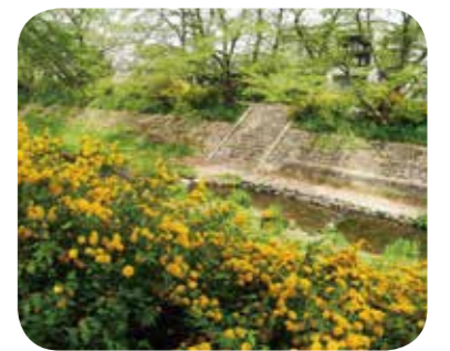
玉川堤のヤマブキ